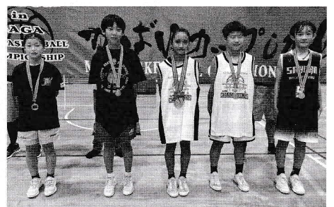
女子ベスト5に輝いた選手たち