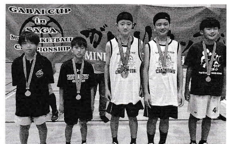
男子ベスト5に輝いた選手たち