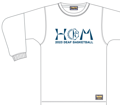
ホワイト/ネイビー