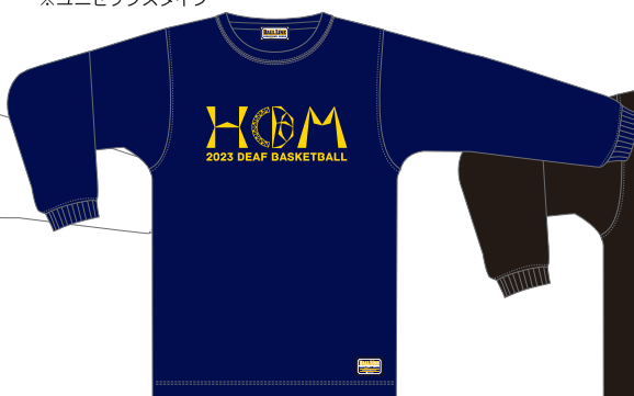
ネイビー/ゴールド(黄色)