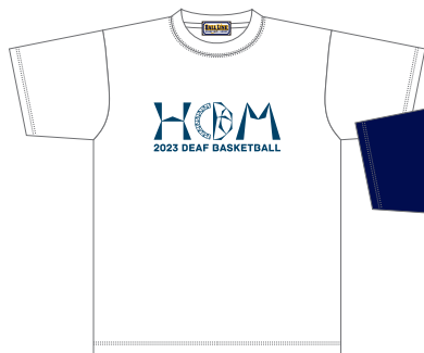
ホワイト/ネイビー