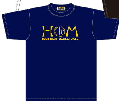
ネイビー/ゴールド(黄色)